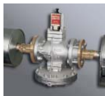
Inst. abur cu pres. joasă