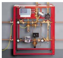
Instalațiile de termoficare