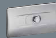
4 nerūsējošais tērauds, matēts 8324.1