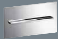
104 metāls, hromēts 8354.1