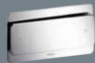
103 metāls, hromēts 8355.1