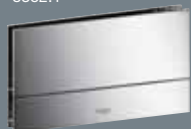
101 metāls, hromēts 8351.1