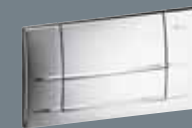
3 plastmasa, hromēta 8313.1