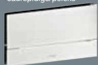
101 ESG*, caurspīdīgs/pelēks