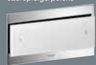
102 ESG*, caurspīdīgs/pelēks