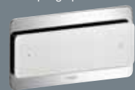
103 ESG*, caurspīdīgs/pelēks