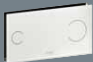
100 ESG*, caurspīdīgs/pelēks