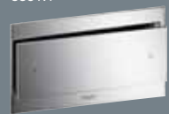
102 metāls, hromēts 8353.1