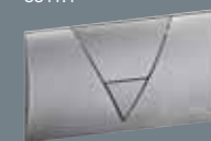
1 plastmasa, nerūs. tēr. tonis 8310.1