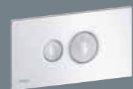
10 plastmasa, Alpu balts 8315.1