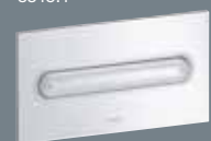
11 plastmasa, Alpu balts 8331.1