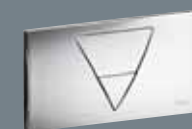
1 metāls, hromēts 8128.1