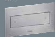
12 plastmasa, nerūsējošā tērauda krāsas 8332.1