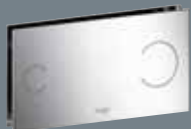
100 metāls, hromēts 8352.1