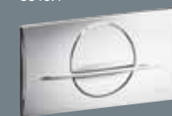
2 plastmasa, hromēta 8312.1