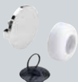
V5 Rezervni delovi za sifone i odvodne garniture