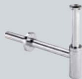
V2 Odvodi za umivaonike i bidee