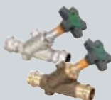
J1 Easytop systemske armature