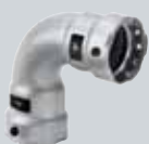
F2 Megapress Press tehnika za debelozidne čelične cevi