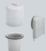
X5 Rezervni delovi za sisteme Advantix i nepovratne ventile