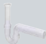
V3 Odvodi za sudopere, izlive i mašine