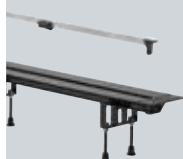
X1 Tuš kanalice Advantix, tuš kanalice Advantix Vario