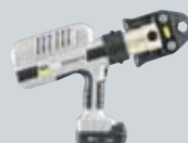
P1 Sistemski press alati