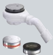
V1 Odvodi za kade i tuš kade Električno kontrolisane mešalice Multiplex Trio E