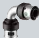
L6 Viega Smartpress Press tehnika sa PE-Xc/Al/PE-Xc cevima